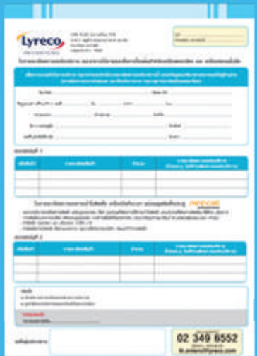
แบบฟอร์มการขอรับบริการ เครื่องตอกบัตรและ เครื่องสแกนนิ้วมือ