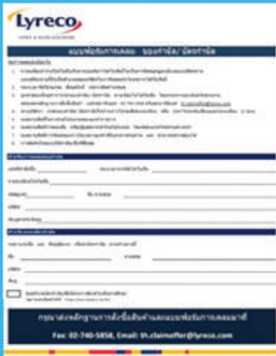
แบบฟอร์มการเคลมของกำนัล / บัตรกำนัล