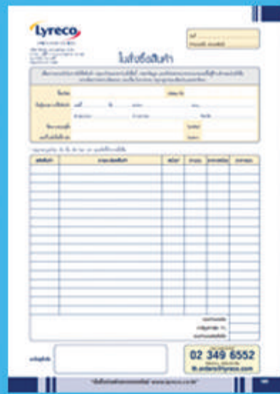
ใบสั่งซื้อ