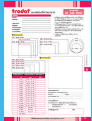
แบบฟอร์มการสั่งทำตราขาย