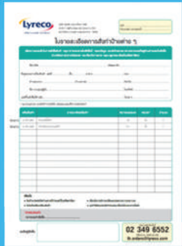
แบบฟอร์มการสั่งทำป้ายต่าง ๆ