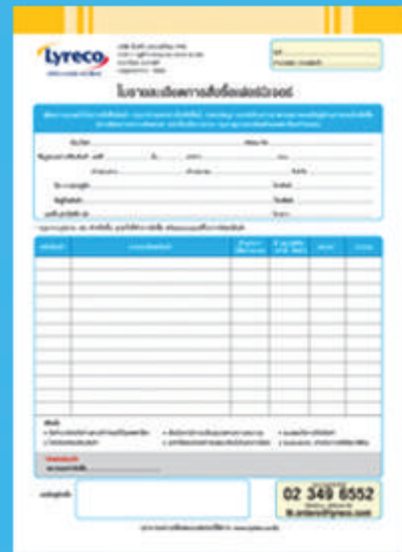
แบบฟอร์มการสั่งเฟอร์นิเจอร์